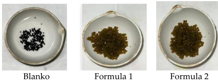
Gambar 1. Sediaan mikroenkapsulasi ekstrak etanol daun mengkudu

Pengamatan SEM terhadap sediaan mikroenkapsulasi ekstrak etanol daun mengkudu dengan perbesaran 1000x, 3000x dan 5000 x menunjukkan mikrokapsul berbentuk dominan bulat hingga hampir bulat dengan ukuran yang bervariasi. Variasi ukuran menunjukkan proses pembentukan kapsul belum seragam.