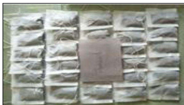
Gambar 2. Teh Celup Kemasan Umbi Bit-Bawang dayak