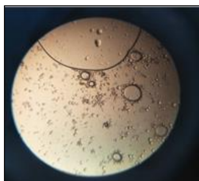
Gambar 3. Gambar Mikroskopik (a) Umbi Bit (b) Bawang dayak