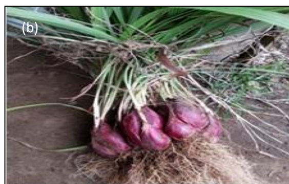
Gambar 1. (a) Umbi Bit (b) Bawang Dayak