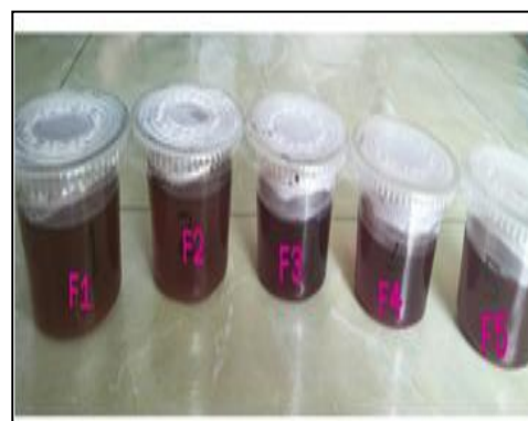
Gambar 4. Seduhan Teh Celup Kemasan Umbi Bit-Bawang dayak

sebagai pemanis alami dalam formula bertujuan untuk meningkatkan cita rasa teh herbal, pemanis tersebut dapat dikonsumsi untuk semua kalangan, terutama untuk penderita diabetes karena daun stevia telah digunakan selama bertahun-tahun untuk terapi alami dalam mengatur kadar gula darah dan dibuktikan sebagai pemanis alami yang tidak karsinogenik, agen antiinflamasi pada tumor kulit, pengobatan diabetes tipe 2, menurunkan tekanan darah pada tikus dan sebagai suplemen dan terapi alternative pada pasien hipertensi (Saqib et al., 2015).